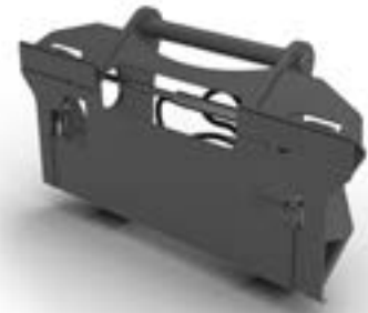
Porte-outil Volvo, type SSL.

Disponible pour : L25 Electric, L30G, L35G