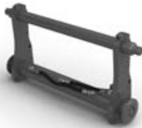
Porte-outil Volvo, type Z.

Disponible pour : L20H/Electric, L25H/Electric