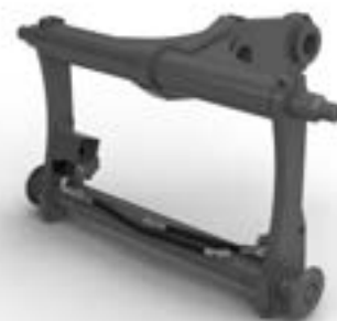
Porte-outil Volvo, type TP-Z.