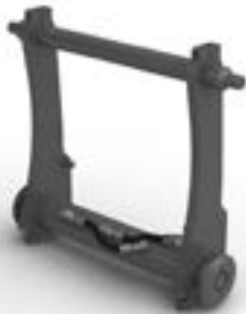
Porte-outil Volvo, type P.

Comme beaucoup de chantiers exigent deux, voire plusieurs accessoires différents, Volvo propose un équipement qui transforme votre chargeuse en un véritable porte-accessoire polyvalent. Le tablier à attache rapide hydraulique, standardisé ISO, permet de passer d'un accessoire à l'autre sans perte de temps, facilement et en toute sécurité. Il suffit d'actionner un contacteur au tableau de bord pour déverrouiller ou verrouiller l'accessoire au tablier à attache rapide – sans quitter le siège et avec une excellente visibilité sur l'accessoire.