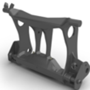
Porte-outil Volvo, type TP-V.

Disponible pour : L20H/Electric, L25H/Electric, L30G